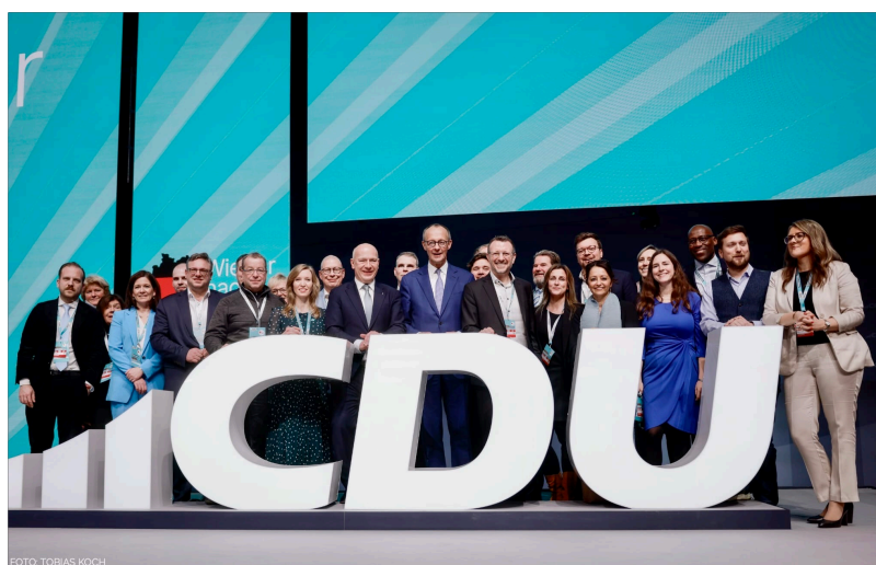
Merz mit den Berliner Delegierten auf dem CDU-Bundesparteitag

Nun wird es auf Friedrich Merz ankommen, schnell und effizient die Koalitionsverhandlungen zu führen, um die großen Herausforderungen anzugehen, die vor Deutschland stehen. Insbesondere auf den Feldern Wirtschaftspolitik, Migrationspolitik sowie Außen- und Sicherheitspolitik warten gewaltige Probleme auf eine Lösung.